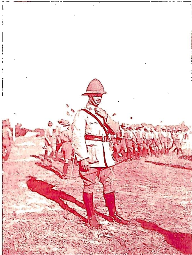
Ο ΤΑΓΜΑΤΑΡΧΗΣ Κ ος Α. CRONSHAW ΚΑΤΑ ΤΗΝ ΕΠΙΘΕΩΡΗΣΙΝ ΤΩΝ ΠΡΟΣΚΟΠΩΝ ΕΝ ΝΟΥΣΧΑ