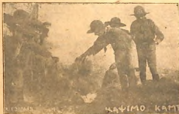
Ἡ 11η ὁμάς Ἀθηνῶν καθαρίζουσα τὰ πεδῆκα ἀπὸ τῆς κάμπιες.

Ἐστερα ἐπιδοθήκαμε σὰ προσκοπικὰ παιγνίδια καὶ σὲ