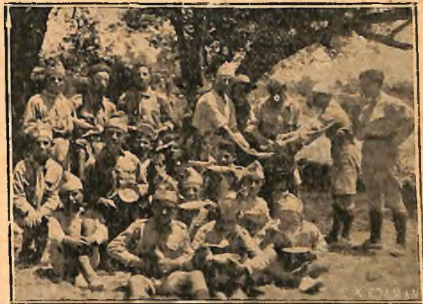
Ἡ οἰκία τῶν Προσκόπων Κεφαλληνίας

Καὶ πλέον καταγοητευμένοι τὴν ἐπομένην κατήλθον μεν εἰς τὴν πλατεῖαν Μαίτλανδ ὅπου διεξήχθη φιλικὸς ποδοσφαιρικὸς ἀγὼν, μετὰ τὸ πέρας τοῦ ὁποίου ἀπῆλθου-μεν, ἵνα ἐπαναπαύσωμεν τὸ κατακουρασμένο σῶμα μας, ἐπειδὴ κατὰ τὴν ἐπαύριον ἐπρόκειτο νὰ ἐκδράμωμεν εἰς