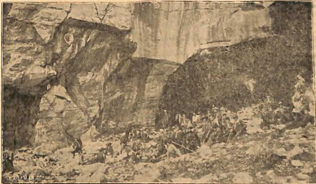
Ἡ σπηλιά τῆς Πεντέλης.

βει τῆς φωλῆς τῆς γλήγουρης νυκτερίδας καὶ τῆς ἀσχημῆς κουκουβάγιας.