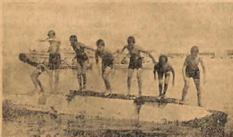
Κολυμβητικὸς ἀγὼν Λυκοπούλων τῆς Ἀγέλης τῆς θῆς Ὁ. Ἀ. ΝΗ. ἐν Π. Φαλήρω τὸ 1937.