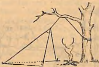
1) Τὸ ἡμιπυραμιδικὸν ἀντίσκηνον, ἰδεῶδες διὰ τὴν ἰπταμένην κατασκηνώσιν.

Ὅταν ἀνεφέρθῃν περὶ σκηναῶν σᾶς ὀμίλησα διὰ τὴν ἡμιπυραμιδικὴν σκηνήν. Πρόκειται περὶ πυραμιδοειδοῦς σκηνῆς κεκομμένης καθέτως εἰς τὰ δύο. Εἰς αὐτὴν δύνασαι νά ἴσασαι ὀρ-