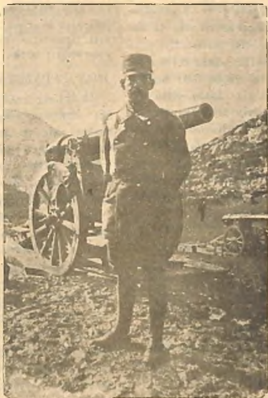
Ὁ Ἀρχηγός μας