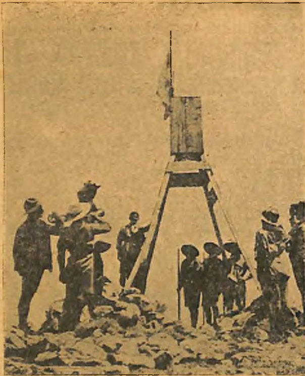
Η 8η Όμάς Αθηνών εις τὴν κορυφὴν τοῦ Ὑμηττοῦ

σθεστικῆς ἀντίλας, τὴν ὁποίαν προμηθεύεται πρὸς ἐξάσκησιν.