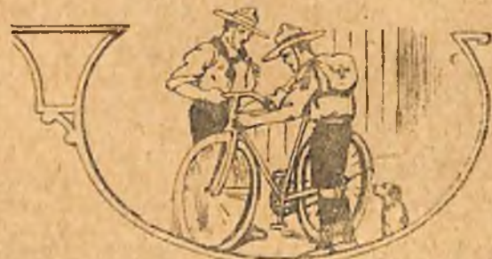
Η ΔΥΟ ΑΡΑΧΝΕΣ

Μιὰ φορὰ κι' ἓνα καιρὸ ἦσαν δύο ἀράχνες κι' ἐξούσανα μέσα σὲ μιὰ ἐκκλησίᾳ σὲ χωριστὸ μέρος ὅμως ἢ μιὰ ἀπὸ τὴν ἄλλη. Μιὰ μέρα λοιπὸν, ποῦ λέτε, σταντηθηκαμε, ἀληθινῶν τὸ λόγο καὶ ὕστερα ἀπὸ τὲς τυπικὰς ἐρωτήσεις γιὰ τὸν καιρὸ, γιὰ τὴ μόδα κλπ., ἄρχισαν νὰ ἐρωτᾶ ἡ μιὰ τὴν ἄλλη ποῦ κάθεται.