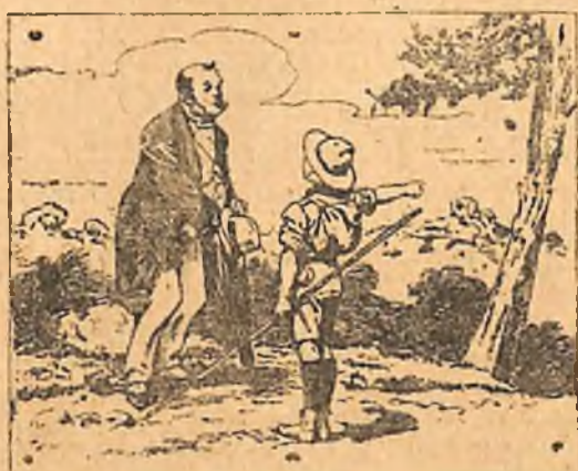
Νά οδηγήσετε έναν ξένον που επισκέπτεται τὸ μέρος σας.

— Λοιπόν, εἶχα ἢ δὲν εἶχα δίκιο πού σου λέγα πῶς ε' ἔκαμ' ὁ φόβος σου; εἶπεν ὁ ἀρχηγὸς ὅταν ὁ Χαστάν ἐγύρισε. Ἄκου καὶ ἡ ἀνησυχία αὐτῆ ἀποδείχθηκε ψεύτικη οἱ Τούρκοι προχωρήσανε στὸ δρόμο τους.