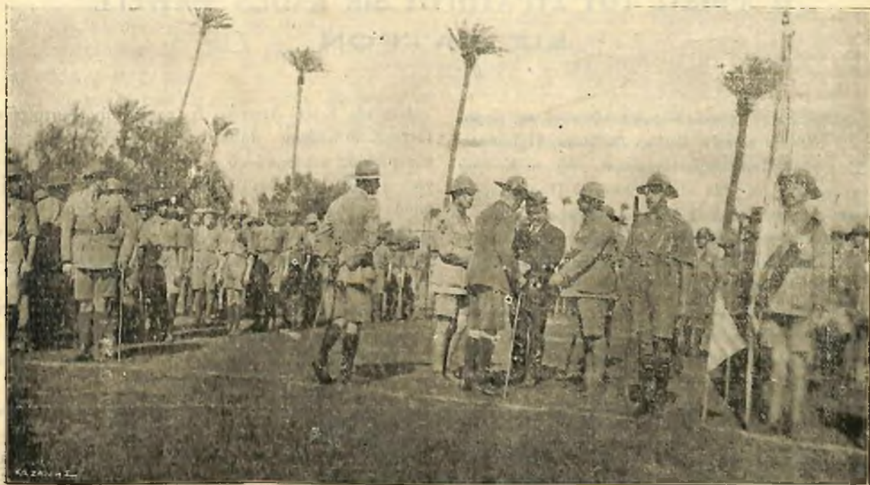
Ο ΣΤΡΑΤΗΓΟΣ SIR BADEN POWELL ΠΡΟ ΤΗΣ ΕΠΙΘΕΩΡΗΣΕΩΣ ΧΑΙΡΕΤΙΖΩΝ ΤΟΝ ΙΔΡΥΤΗΝ κ. ΜΑΡΚΟΝ ΔΙΟΥΜΗΝ